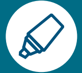
APPOSITION D'UNE MARQUE DE COULEUR