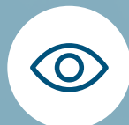
MOTEUR DE RECHERCHE PERFORMANT

Recherchez selon vos propres critères et partagez l'ensemble de l'information contenue dans les documents de l'entreprise