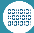
ANALYSE ET GESTION DES MÉTADONNÉES