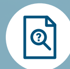
RECHERCHE DANS LE CONTENU OU LES PROPRIÉTÉS