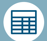
AFFICHAGE SOUS FORME DE TABLEAU OU DE VIGNETTE